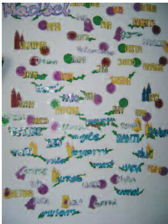
Mural realizado por los usuarios permanentes de FUNDAMIFP en la Navidad 2008