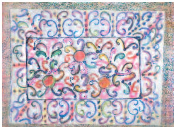
Dibujo realizado por: Maite Mayor. Beneficiaria de AMIFP